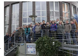
Die Teilnehmer des 3. ICBM-Doktorandentages vor dem Wilhelmshavener ICBM-Gebäude.

Im März 2018 hat zum dritten Mal der ICBM-PhD-Day stattgefunden. Am ICBM Standort in Wilhelmshaven hatten Doktorand/innen Gelegenheit sich über ihre Forschungsthemen und Methoden auszutauschen und sich zu vernetzen. Neu im Programm waren Kurzvorträge sogenannte „Elevator Pitches“, hier konnten die Promovenden ihre Forschungsidee in 2-3 Minuten präsentieren, ähnlich lange, wie die Dauer eines Aufzugaufenthaltes.