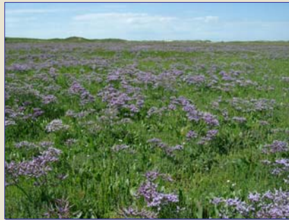
Zwei typische Arten nordwestdeutscher Salzwiesen

Die Pflanzen haben sich an diesen extremen Lebensraum bestens angepasst. Sie trotzen dem mechanischen Stress durch Wellen, der Sauerstoffarmut im Boden und dem salzigen Milieu in ihrem Lebensraum. Nur so sind sie ihren Süßwasserkonkurrenten im Wettbewerb überlegen.